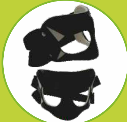
Ortéz hlavy a tváre