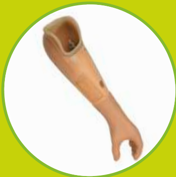
Protézy HK a predlaktia