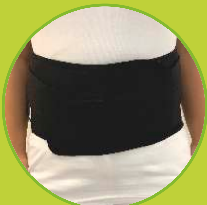
Bedrové pásy vystužené s dvojším ťahom