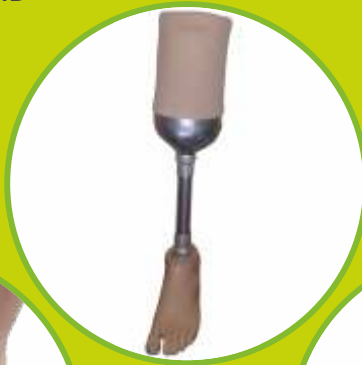
Protézy predkolenné privykacie, definitívne