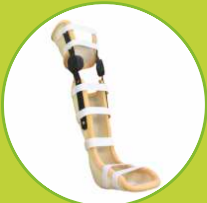
Ortézy s limitovaným rozsahom fixačné