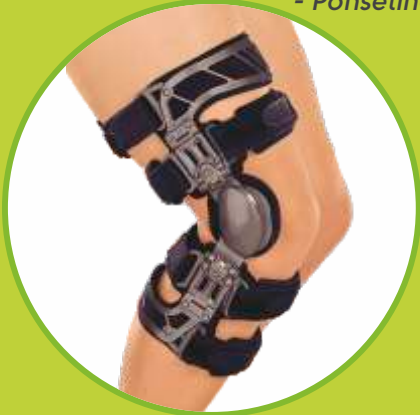
Ortézy na varózne a valgózne koleno