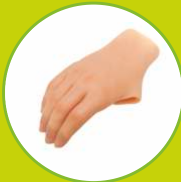
Protézy ruky silikónové