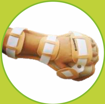
Ortézy zápästia a ruky antispastické