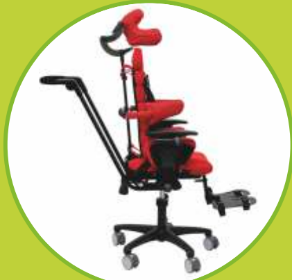
Ortéz trupu sedacie polohovacie