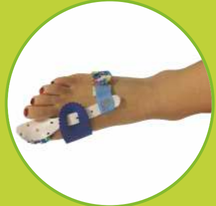
Ortézy na hallux valgus