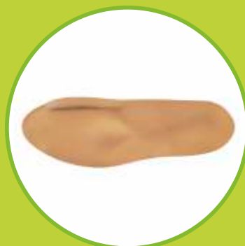
Ortopedické vložky s uškom