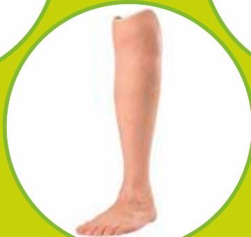
Protézy predkolenné silikónové definitívne