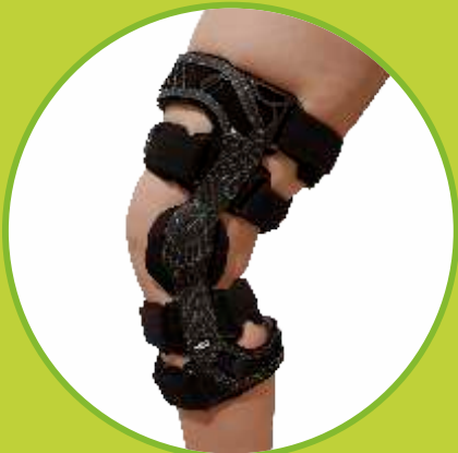
Ortézy kolena s nastaviteľným rozsahom pohybu, štvorbodové