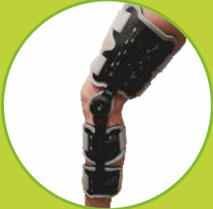
Ortézy dynamické so silovou jednotkou v kĺbe s možnosťou odpojenia silovej jednotky počas záťaže priamo na pacientovi