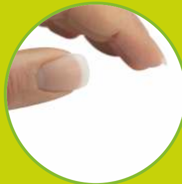
Protézy prstov silikónové