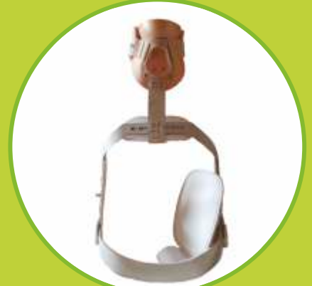
Ortéz trupu a krčnej chrbtice fixačné