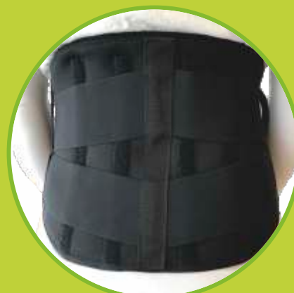
Bedrové pásy vystužené s dvojším ťahom