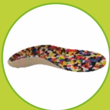
Ortopedické vložky korytkové