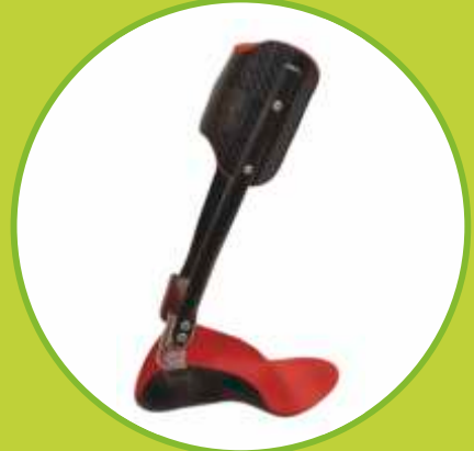
Ortézy dynamické, karbónové na padavú nohu