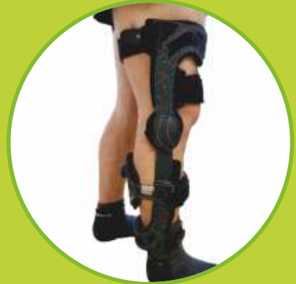
Ortézy kolenného kĺbu, štvorbodové, pri zranení zadného krížneho väzu