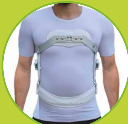
Ortéz trupu fixačné s kĺbom