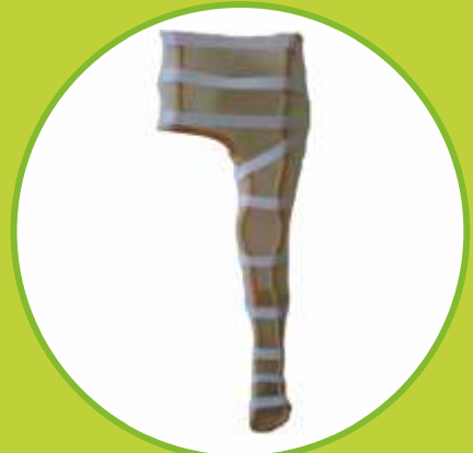
Ortézy na celú DK fixačné