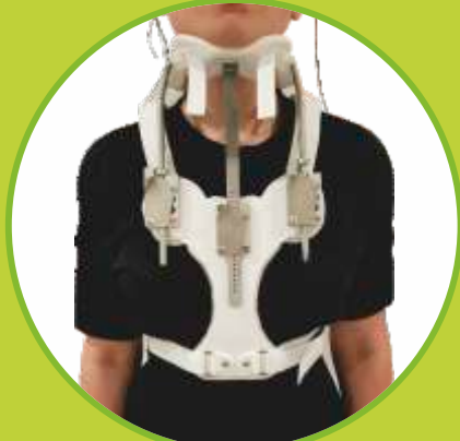
Ortéz trupu a krčnej chrbtice fixačné