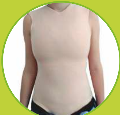
Ortéz trupu fixačné