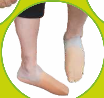
Protézy nohy silikónové privykacie