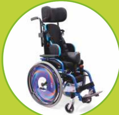
Ortéz trupu sedacie polohovacie