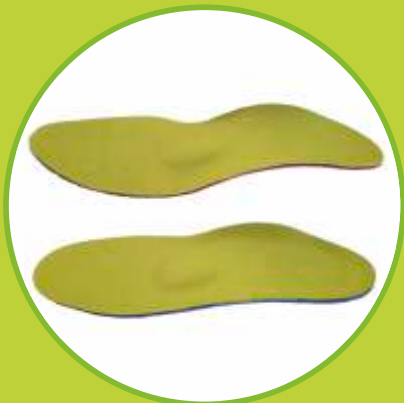
Ortopedické vložky špeciálne