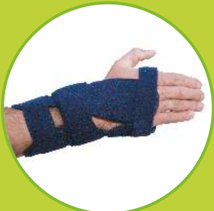
Ortézy zápästia fixačné, karpálny tunel