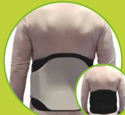
Ortéz trupu stabilizačné, odľahčujúce v TLSO