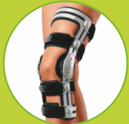
Ortézy kolena na genu recurvatum