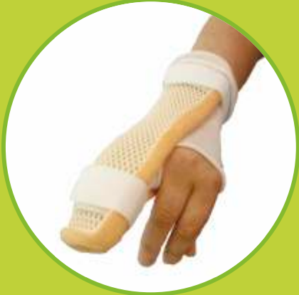
Ortézy zápästia, ruky a prstov fixačné

Predpisujúci lekár: OPR, ORT, CHI, TRA, RHB