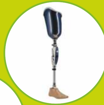
Protézy stehenné privykacie, definitívne