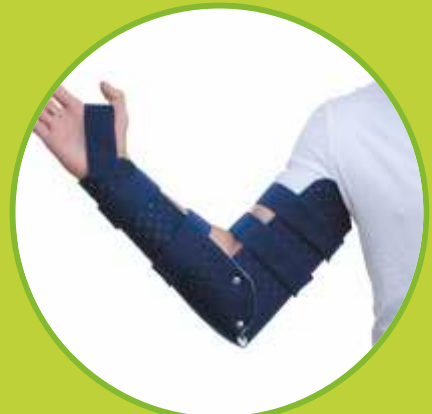
Ortézy lakťa fixačné