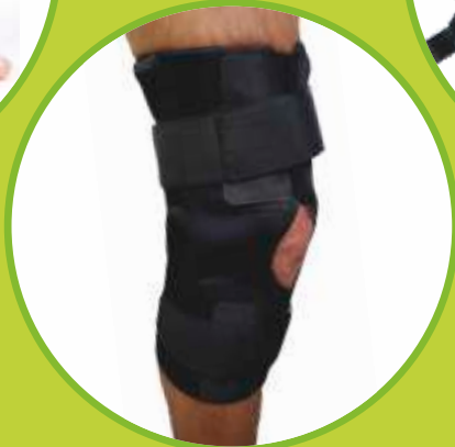
Ortéz kolena bez dláh Ortéz kolena s dvojosími dlahami Ortéz kolena s pružinovými dlahami