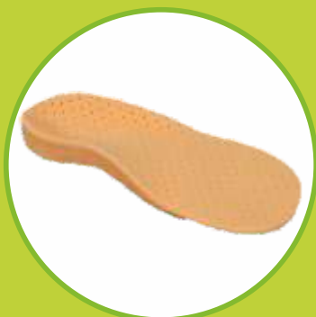
Ortopedické vložky korytkové