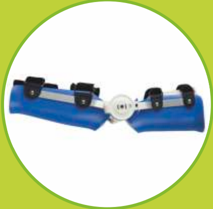
Ortézy dynamické so silovou jednotkou v kĺbe