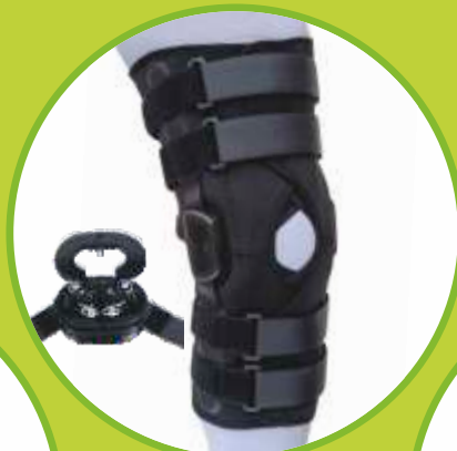
Ortéz kolena s nastaviteľným rozsahom pohybu