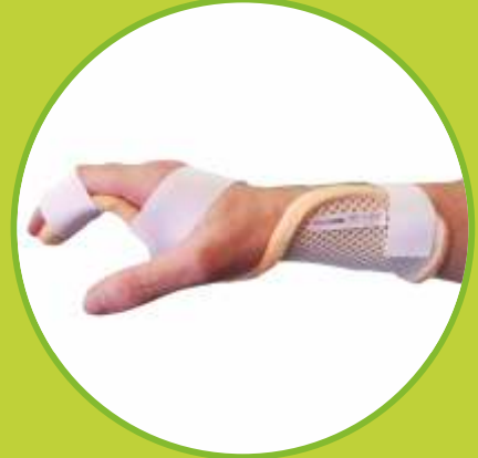
Ortézy zápästia a ruky fixačné