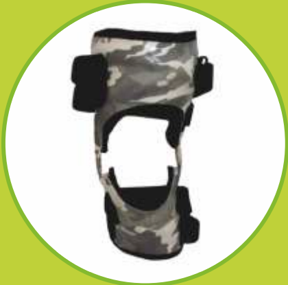
Ortézy kolena vystužené, objímkové, extra pevné