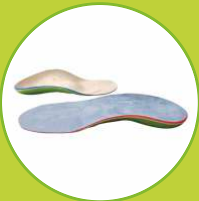
Ortopedické vložky špeciálne