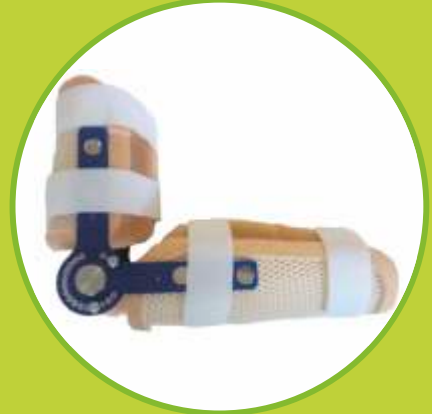
Ortézy lakťa s nastaviteľným rozsahom pohybu