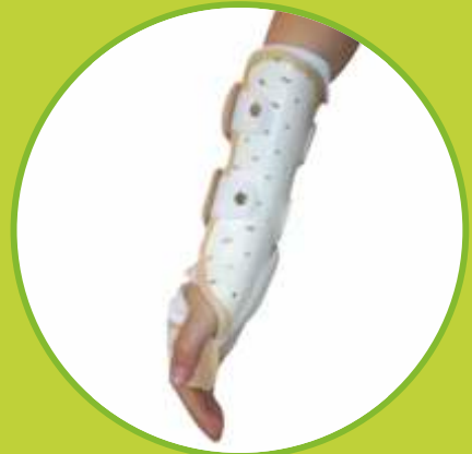
Ortézy zápästia a ruky fixačné