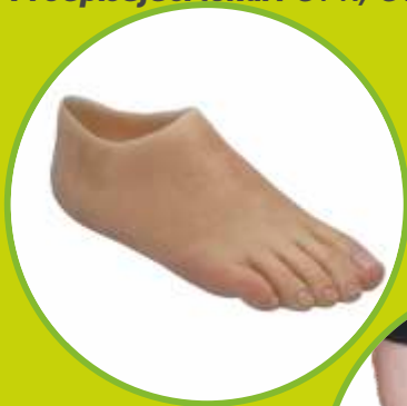
Protézy nohy silikónové definitívne

Predpisujúci lekár: OPR, ORT, CHI, TRA, RHB