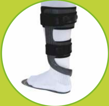
Ortézy na padavú nohu karbónové

Predpisujúci lekár: OPR, ORT, CHI, TRA, RHB