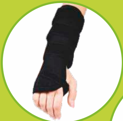
Ortéz zápästia s dlahou

Predpisujúci lekár: OPR, ORT, CHI, TRA, RHB