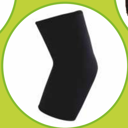
Ortéz lakťa bez dláh Ortéz lakťa s dvojosími dlahami Ortéz lakťa s pružinovými dlahami