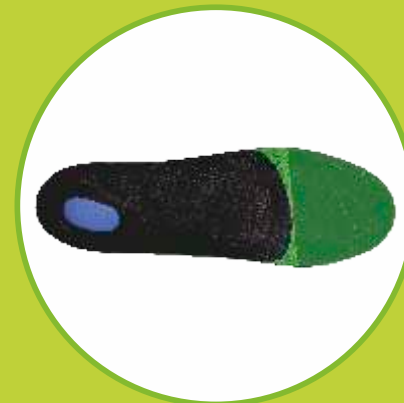
Ortopedické vložky na calcar calcanei