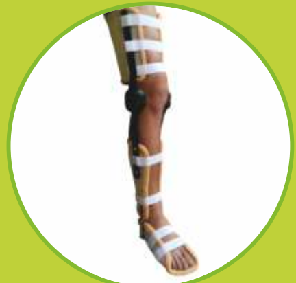
Ortézy s kĺbom z termoplastu fixačné