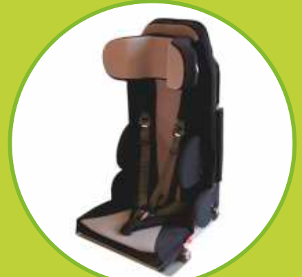
Ortéz trupu sedacie polohovacie