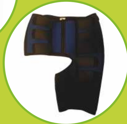
Ortéz bedrového kĺbu bez dláh Ortéz bedrového kĺbu s dlahami s nastaviteľným rozsahom pohybu Ortéz bedrového kĺbu s pružinovými dlahami