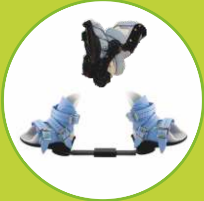
Detské abdukčné dynamické ortézy - Denis Brown - Ponsetiho aparát

Predpisujúci lekár: OPR, ORT, CHI, TRA, RHB