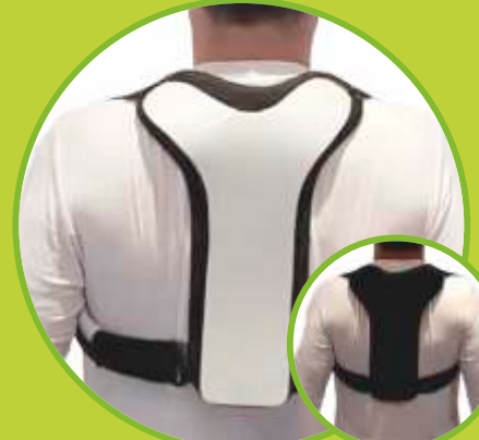
Anatomicky tvarované ortézy trupu: redresné, stabilizačné, odľahčujúce, upomínacie