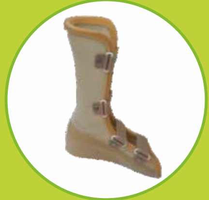
Ortézy DK WALK