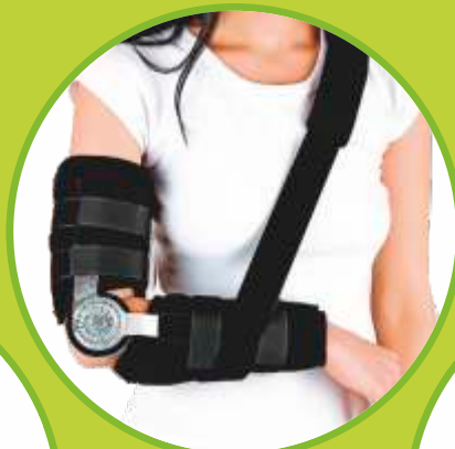
Ortéz lakťa s nastaviteľným rozsahom pohybu