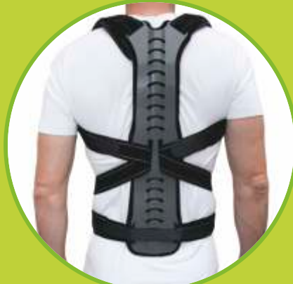
Ortéz trupu rigidne odľahčujúce