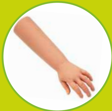
Protézy HK a predklatia

Predpisujúci lekár: OPR, ORT, CHI, TRA, RHB