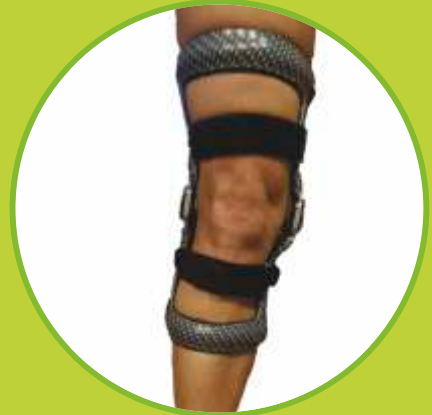
Ortézy kolena vystužené, objímkové, aktívne, extra pevné